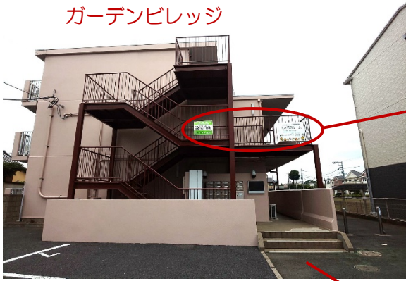
ガーデンビレッジ

新京成線「みのり台駅」徒歩5分 駐車場利用の場合は、ケーヨーデイツー前のコインパーキングが利用できます